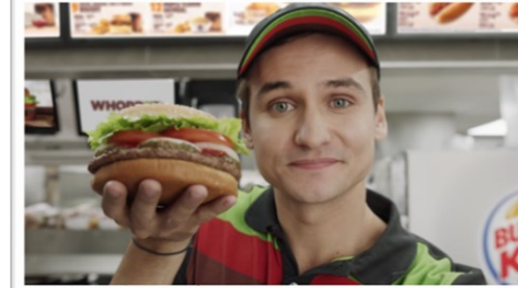
The infamous commercial BURGER KING

A lover of Android, keyboards, and other things that go beep.